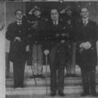
El nuevo Ministro de la República Mexicana, Excmo. señor Juan de Dios Bojórquez, a la salida de Palacio.