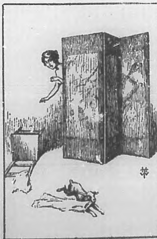
Las travessuras de Pichicho.

(¡No sé si he dicho que el bosque está triste; si no, lo repito, que es cosa que agrada y es cosa que viste.)