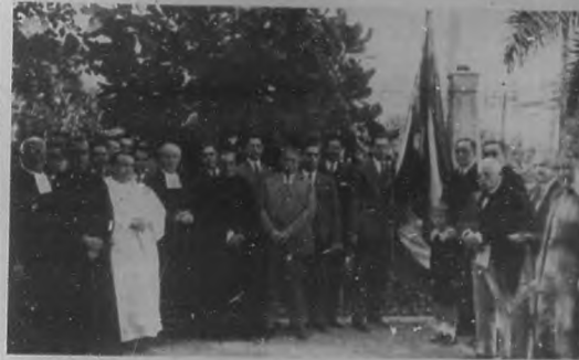
Momento de izar la bandera cubana en la fiesta celebrada con motivo de la inauguración del local social de la "Fraternalidad de La Salle".

con motivo de la inauguración del nuevo local de la "Fraternalidad de La Salle".