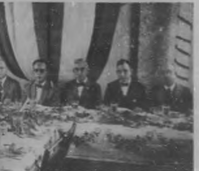
Presidentes del simposio ofrecido en el Colegio de Arquitectos en honor de los miembros de la Directiva de una Institución.

lacio, después del acto de la presentación de credenciales, es que resultó muy lucido.