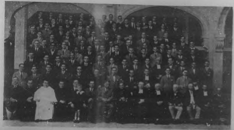
Grupo de personalidades y antiguas alumnas del colegio "La Salle", que participaron de la solemnidad de esta celebración.

Este Cupón, después de lleno, debe enviarse a la Redacción de BOHEMIA, Trocadero 89-93, Habana, o ser depositado en el Buzón, que para el efecto, ha sido colocado en nuestras oficinas.