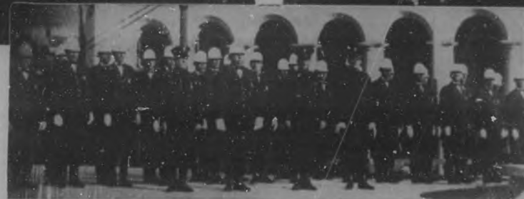
El general Mendieta y los miembros de la nueva Sección del Turismo, a la salida del Palacio Presidencial, después de ofrecer sus respetos al general Machado.