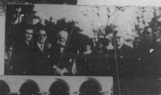
El honorable Presidente de la República y los familiares del insigne patriota Manuel Sanguely, durante los actos celebrados en el Cementerio de Colón para conmemorar el primer aniversario de su muerte.