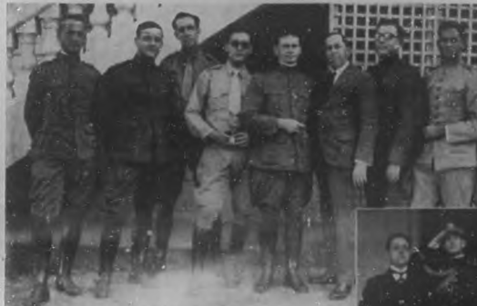
Los distinguidos oficiales de nuestro Ejército, que recientemente fueron reelectos en sus cargos de la Directiva del Circuito Militar de Columbia.